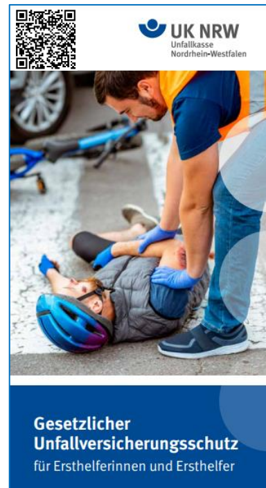
Gesetzlicher Unfallversicherungsschutz für Ersthelferinnen und Ersthelfer

Psychotherapeuten, die bei der DGUV gelistet sind, müssen garantieren, dass innerhalb einer Woche nach Kontaktaufnahme die Behandlung beginnt.